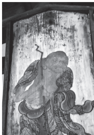
日本京都南禪寺之跋陀婆羅像，標牌文字為： 「浴室守護佛 跋陀婆羅菩薩」（2018.08.24 攝）