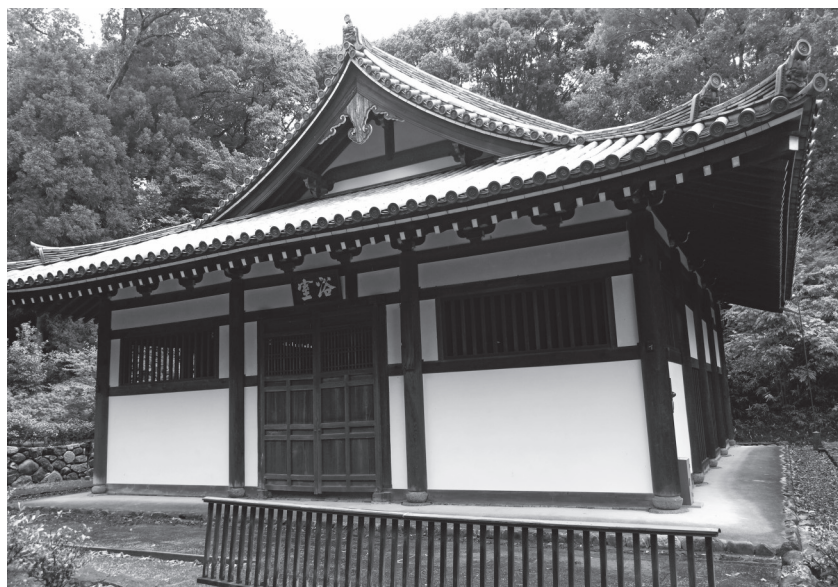
京都東福寺之浴室建築，內有蒸氣浴室（現存禪宗寺院最古老的浴室。室町時代，長祿三年（1459 年），2018.08.16 攝）。