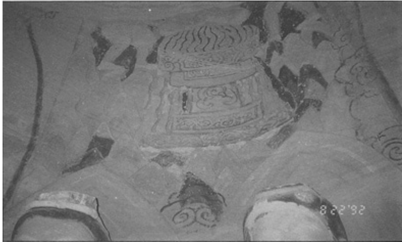
圖七、北石窟寺窟頂東北角的浮雕荼毘場面。群山中有一著火之棺，棺上有一結跏趺坐之佛，佛兩側有護衛之力士，坐佛及力士坐身均已風化。