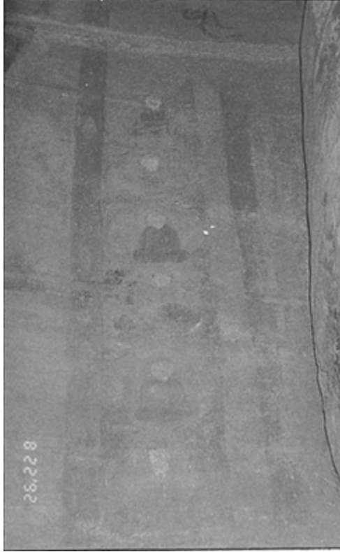
圖五、立佛背光中一連串之小坐佛、代表佛的無數化身