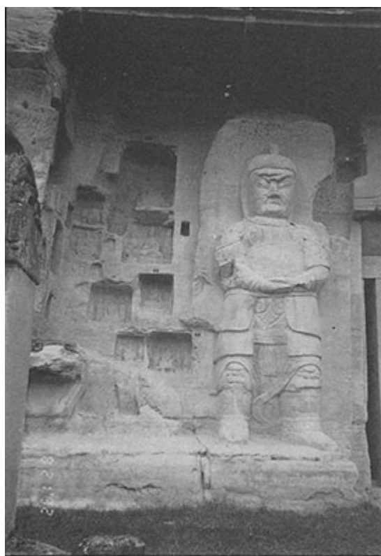
圖二、甘肅慶陽北石窟第 165 窟，圖為門側之護法天王及蹲獅。