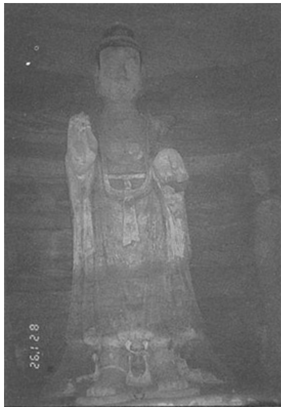
圖八、南石窟寺的立佛之一。