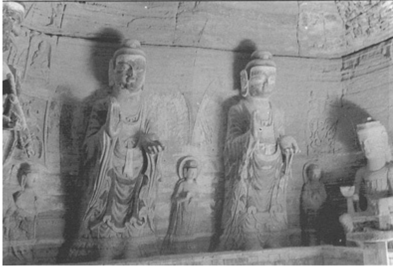
圖三、北石窟寺的大立佛，脅侍菩薩及門側的倚坐彌勒菩薩。