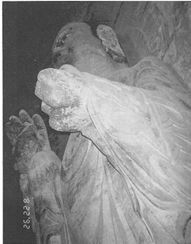
圖四、北石窟寺的大立佛之一，代表已取涅槃但不滅度的過去七佛。