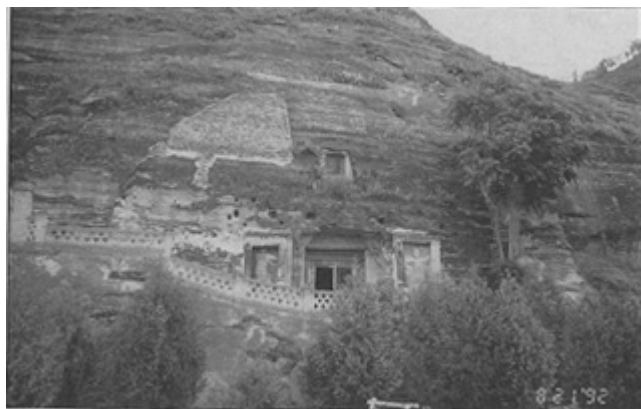
圖一、甘肅涇川南石窟第一窟，開兩側之力士經後世重刻，開土開有明窗。